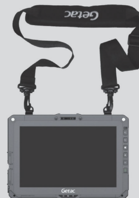
タブレットとの 装着イメージ