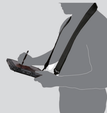
肩にかけて 使用するイメージ