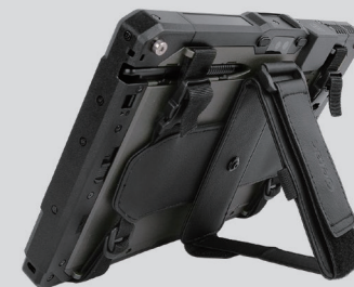
スタンドを立てたイメージ